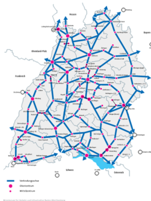
Abbildung: Einblick in RadVIS

Mit RadVIS wird das Radfahren attraktiver, da Lücken identifiziert werden können und Radinfrastruktur gezielt und effizient verbessert und ausgebaut werden kann.